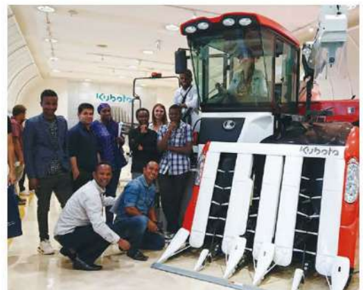
大型ハーベスターはとってもカッコよくて研修員に大人気