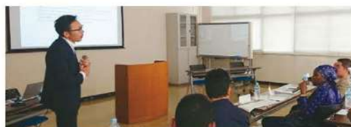
講義を聞く研修員