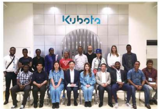
お世話になったクボタの皆さんとの記念写真です

クボタでは1980年代よりODAにて新興国向けに農業機械を輸出しており、新興国とは長い付き合いを有しています。一方で、我々の会社概要や海外進出事例をそれらの国の方々に紹介する事は普段あまりないため、このような機会を頂いたことを大変喜ばしく思っています。今回の研修員の生活エリアは都市部のため、我々の製品をイメージすることが難しかったと思いますが、講義当初より研修員から鋭い質問が飛び交い、活発な意見交換の場となりました。この講義を通じて少しでも日本企業の新興国での取組みを理解頂き、将来我々のサポート役を担って頂ければ嬉しい限りです。ありがとうございました。