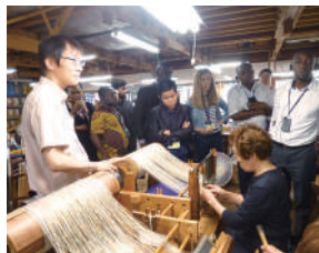
石川県無形文化財の高級麻織物「能登上布」の織元「山崎麻織物工房」を訪問。