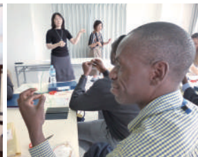
金沢市の希少伝統工芸「水引細工」を装飾品から空間インテリアへ商品開発する自遊花人で水引づくりを体験。