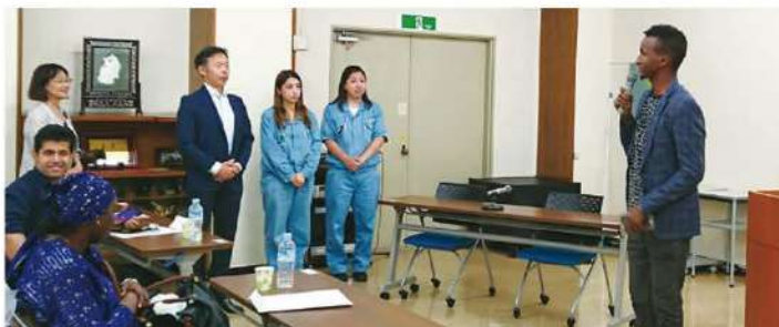
ソマリアのディリエさんから見学に対してお礼のスピーチ