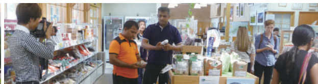
道の駅奥大山を視察。 日本海新聞から取材を受ける研修員。