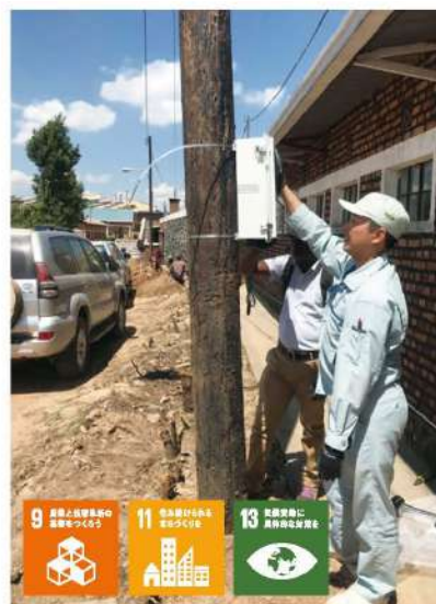
雷センサを設置する様子